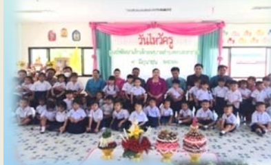
วันไหว้ครู