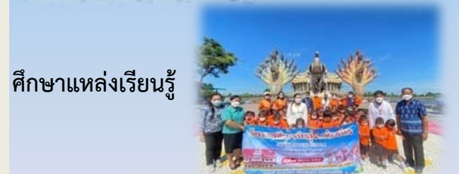
ศึกษาแหล่งเรียนรู้