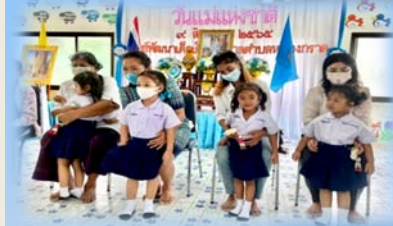
วันแม่แห่งชาติ