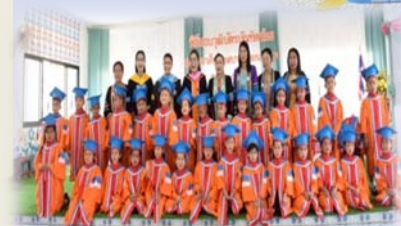
พิธีรับอนุบัตร