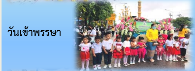
วันเข้าพรรษา